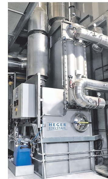
Heger-Wärmerückgewinnungsanlage in Hinterstoder

rechte Qualitätsarbeit auf Basis des innerbetrieblichen Know-hows in sämtlichen Produktionsabläufen ausgeführt.