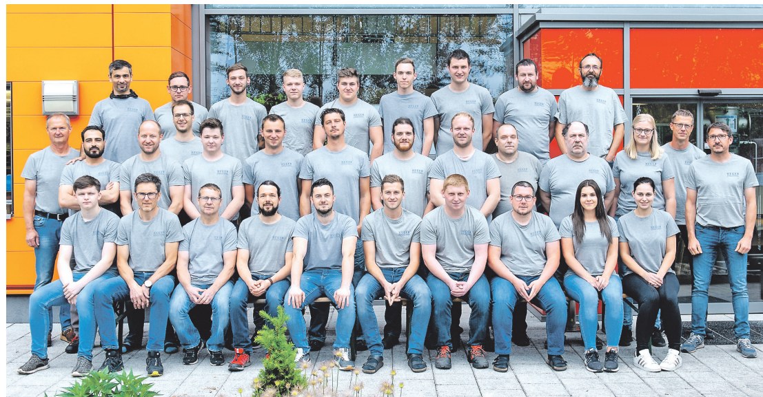
Das engagierte und motivierte Team von Heger Edelstahl in Schardenberg.

Von Wärmerückgewinnungsanlagen und Wärmetauschern über verschiedenste Behälter bis zu Sonderanfertigungen aus Edelstahl werden sämtliche Erzeugnisse in der eigenen Produktionshalle in Schardenberg gefertigt. Bestens geschulte Mitarbeiter verwenden dazu hochmoderne Fertigungstechnologien wie z. B. Schweißroboter, Wasserstrahlschneidanlage, Schweißsysteme sowie verschiedene Blechbearbeitungsmaschinen. Um den Qualitätsstandard zu halten, investiert